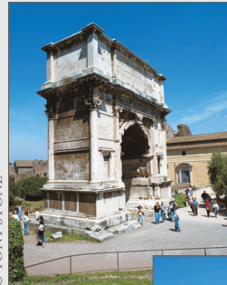
Titusbogen, Rom, 81 n. Chr.

Wenn du die drei Bauwerke betrachtest, erkennst du leicht ihre Gemeinsamkeiten, obwohl ihre Bauzeit fast 2000 Jahre auseinanderliegt.